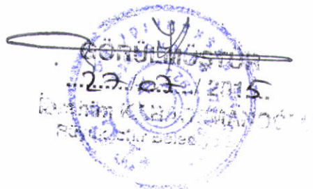
Özlem EKŞİ ŞAHİNKAYA Katip üye (2.Yedek)